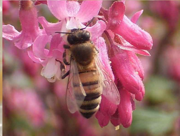
Vlašská (či talianska) včela